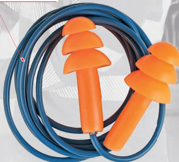
Praktisches Etui zur Aufbewahrung von Ohrstöpseln über mehrere Schichten hinweg

Wir erweitern das Angebot an Schutzmitteln um unsere eigene Ohrstöpsellinie CXS CORTIX. Gehörschützer eignen sich für den Einsatz in Branchen mit höherem Lärmpegel. Die markante orange Farbe der Protektoren sorgt für hohe Sichtbarkeit. Es gibt klassische Einwegstöpsel FEP-03 aus weichem Polyurethanschaum, der sich an die meisten Gehörgänge anpasst und den Druck im Ohr gleichmäßig verteilt. SNR-Dämpfungswerte von 34 dB. Um den Verlust des Stopperschutzes zu verhindern, kann das Modell FEP-03C mit Lanyard gewählt werden. EP-06TC-Plugs aus Monopren können gewaschen, im praktischen Etui aufbewahrt und mehrfach verwendet werden.